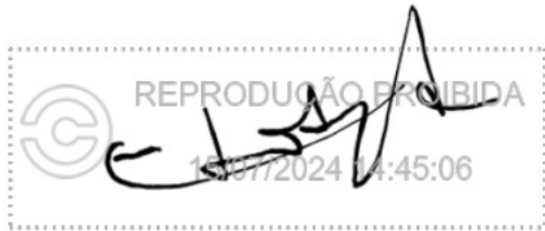
Eduardo Varella Avila 15 jul 2024, 14-45-06.png

Assinatura manuscrita com hash SHA256 prefixo d0ede5(...)